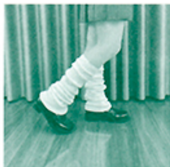
一世を風靡したルーズソックス。写真のような「だらしない履き方」が一般化するのを恐れ、多くの学校が先手を打って校則で禁止した

ブラック校則、世間知らずの教員、隠ぺい体質…学校のおかしさの本質に迫りつつ解決策を模索する、父＝教員VS娘＝実習生の対話