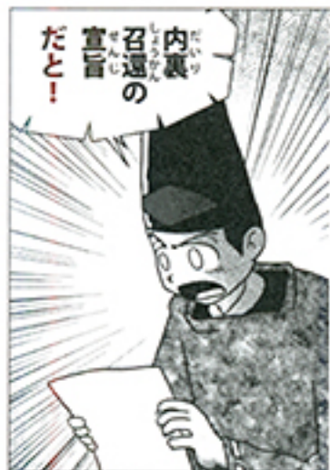
第十三帖「明石」より。ついに流謫の日々が終わり、源氏派の捲土重来なるか？

ついに流謫の日々が終わりを告げ、源氏派の巻き返しを開始。「明石」続編～「関屋」の本巻で第Ⅰ期〈青春編〉堂々完結!!