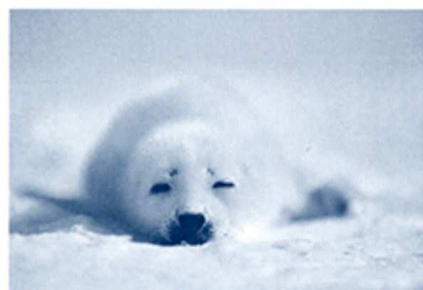
タテゴトアザラシの赤ちゃん。温暖化による流氷の消失で、この後溺死してしまったと思われる(撮影地:カナダ東部セントローレンス湾、©高砂淳二)

「気候変動問題を巡る旅」 数々のグローバルな「現場」へ読者を誘い、気候・環境問題を等身大の視線で見つめる旅。四六並製 一三四頁 一九八〇円