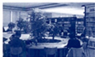
神奈川県大和市立中央図書館「シリウス」。マンガも豊富に所蔵している

子どもを本嫌いにする読書教育はもうやめよう!「読書で人生が変わった」数々の実話から読書の真の価値と適切な指導法を探る