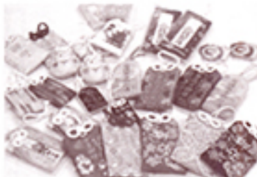
1855年創業、西陣織の「秋江」が手がける御守袋。一般に流布するこの形は同社が考案したもの

同族経営の強みをいかに発揮し、時代に即した試みで長らえる京の同族経営企業。その伝統継承と革新の歴史と今に学ぶ本格研究