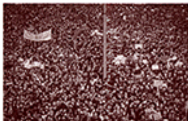
2019-20年民主化動乱で街路を埋め尽くす香港の人々(2019年6月9日撮影Hf9631)。デモの看板は「逃亡犯条例改正反対」だったけれども、その根底にあったのは「腐敗」への人民の怒りだ。

発行所 © 新評論 2021年 〒169-0051 新宿区西早稲田3-16-28 TEL03-3202-7391 FAX03-3202-5832 http://www.shinhyoron.co.jp e-mail: shrn@shinhyoron.co.jp 振替 00160-1-113487 価格税込