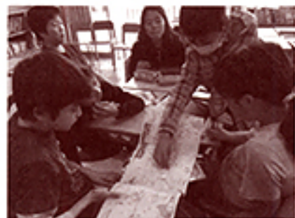
子どもたち自身が社会科学習を主導する教室は、主体的な市民から構成される「理想の社会」の縮図でもある。

「教科書をなぞる」一方向の授業はもうやめよう!生徒が主体的に学ぶワークショップ形式で教室が生き生きと変貌。