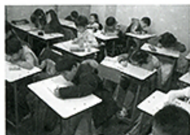
テストのための暗記型学習を子どもたちに押しつけるのはもうやめよう！

発行所 © 新評論 2021年 〒169-0051 新宿区西早稲田3-16-28 TEL03-3202-7391 FAX03-3202-5832 http://www.shinhyoron.co.jp e-mail: shrn@shinhyoron.co.jp 振替 00160-1-113487 価格税抜