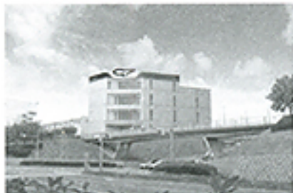
日本最大の法人フランチャイジー「G7ホールディングス」本社（神戸市）。カー用品店「オートボックス」が有名だが、現在は人気の「業スー」事業でも飛躍している。

今や市場26兆円にのぼるフランチャイズ事業。丹念な実地調査でベールに包まれてきたその実態を初めて詳細に解明する意欲作！