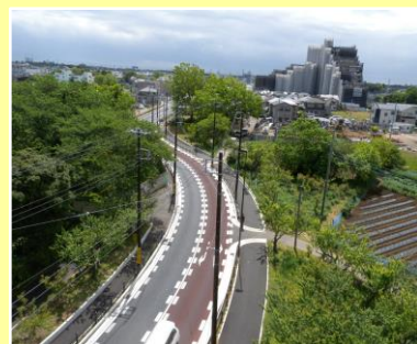
梅林等の中を通る新しい道路